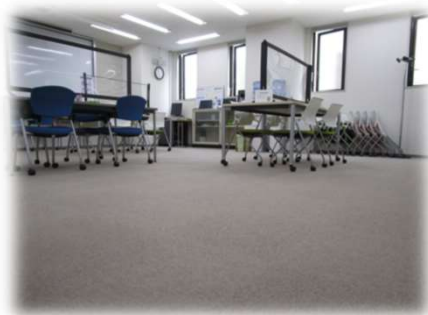
[タイルカーペット]

新型コロナウイルス感染症拡大に伴い、学内での学習機会が増えました。安心安全に学生が学べるように、学習環境整備への支援を行いました。